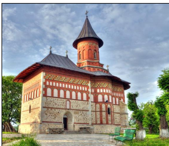
Fig. 1. Biserica Sf. Nicolae din Dorohoi

Așezământul păstrează pe partea dreaptă de la intrare pisania dăltuită cu caractere slavone, din care se pot citi următoarele: „Binecinstitorul și de Hristos iubitorul Io Ștefan Voievod, din mila lui Dumnezeu, domn al Țării Moldovei, fiul lui Bogdan Voievod, a zidit acest hram întru numele celui între sfinți, părintele nostru, arhierarhul și făcătorul de minuni Nicolae; și s-a săvârșit în anul 7003, luna octombrie 18, iar al domniei lui al 39-lea curgător” 3 . Așadar, domnul Moldovei ridică în târgul Dorohoi, în anul 1495, o biserică de zid, cu hramul Sf. Nicolae. Biserica domnească este menționată și în mărturiile documentare păstrate până la noi. Astfel, într-un document din decembrie 1628, „popa Iordachie cel domnescu și diaconul Ștefan” din „târg de Dorohoi” sunt prezenți la vinderea unui sălaș de țigani 4 . Se observă importanța pe care o aveau preoții în acea perioadă. Mai mult chiar, se spune că cei de la bisericile domnești beneficiau de privilegii suplimentare 5 .