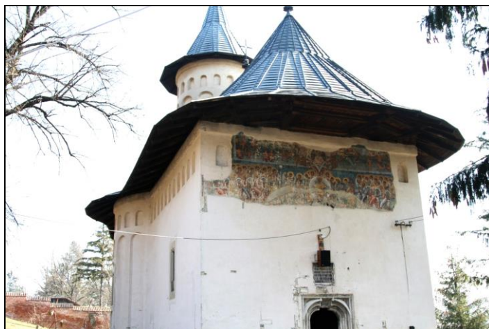
Fig. 3. Biserica Sf. Nicolae, sat Coșula, județul Botoșani

se încheie cu o cruce pe care este răstignit Iisus, iar de o parte și de alta se găsesc apostolul Ioan și Fecioara Maria. Stilul folosit în pictarea icoanelor este bizantin, culorile fiind de nuanțe pale, simbolizând dematerializarea lumii sfinte. Cel mai des sunt folosite culorile albastru, roșu, verde și alb 109 . Icoanele sunt despărțite de colonete decorate cu motive vegetale.