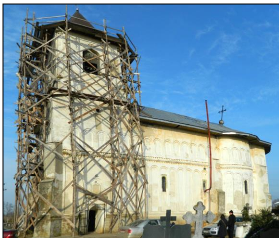
Fig. 5. Biserica Sf. Parascheva, oraș Ștefănești, județul Botoșani