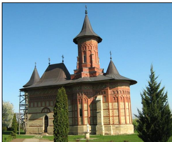
Fig. 2. Biserica Sf. Nicolae – Popăuți, orașul Botoșani

fiind albastru, roșu, verde și alb 56 . Icoanele sunt despărțite între ele de colonete decorate cu motive vegetale.