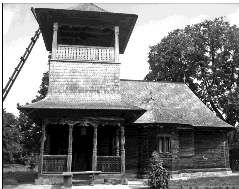
Fig. 1. Biserica Adormirea Maicii Domnului din satul Brăești

Monumentul istoric, aflat la intrarea în sat, păstrează pe ancadramentul peretelui pridvorului inscripția dăltuită cu caractere chirilice, de unde transcriem faptul că lăcașul a fost ridicat în anul 1745 de boierul Miron Gorovei 25 . Astfel, „(a ridicat aceas)ta sv(i)nta beserica de Miron Gorovei cămărașul în hramul Adormirii Maicii lui Dummedza(u), iuni(e), let 7253 (1745), 13”. Deși pisania este gravată cu văleatul 7253 (1745), în istoriografie sunt întâlnite alte două ipoteze privind datarea bisericii. Una dintre acestea este lansată de arhitectul Titu Elian, care plasează ridicarea edificiului în anul 1770, conform „inscripției făcute de boierul Miron Gorovei, proprietarul moșiei” 26 , iar cealaltă este formulată de preotul Ioan Canciuc care estimează începuturile construcției în anul 1790 27 .