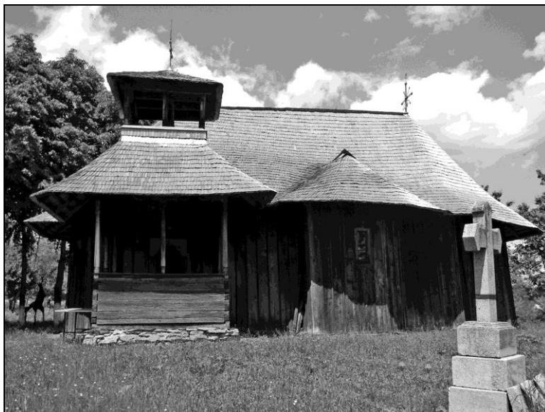
Fig. 5. Biserica Adormirea Maicii Domnului din satul Cervicești

Monumentul istoric aflat la marginea satului păstrează pe ancadramentul ușii de la intrare, pisania inscripționată cu caractere chirilice, de unde aflăm următoarele: „Această Sfântă Biserică a fost făcută cu toată cheltuiala dumisale Constantin Miclescu biv vel pitar și a lucrat Ioan sin Dumentii și Grigore Lungu, în zilele Măriei Sale Alexandru Ipsilanti, cu blagoslovenia Sfinției Sale Părintelui Mitropolit Leon din leatul 1787”. Așadar, biserica a fost ridicată de unul dintre boierii familiei Miclescu, Constantin Miclescu, fiul lui Sandu Miclescu și al Saftei 75 , în timpul domniei în Moldova a lui Alexandru Ipsilanti (decembrie 1786 – aprilie 1788) și a păstoririi mitropolitului Moldovei, Leon Gheucă (1786-1788).