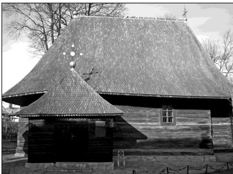
Fig. 4. Biserica Adormirea Maicii Domnului și Nașterea Maicii Domnului din orașul Dorohoi

catedralei, în jurul bisericii vechi, pentru un timp au avut loc numeroase discuții între localnici, preoții parohi, funcționarii de la Minister și, nu în ultimul rând, Mitropolie. Pe când localnicii doreau construirea unei alte biserici în Dorohoi, Mitropolia nu accepta ca lăcașul din lemn să fie desființat sau mutat de acolo, iar Ministerul Cultelor nu era de acord să semneze pentru desființarea lui. Deși enoriașii își doreau un nou edificiu religios, Mitropolia și Ministerul nu au aprobat cererea de dărâmare a acesteia, ci au cerut dorohoienilor să repare vechiul așezământ. În consecință, s-a făcut o nouă intervenție în anul 1895 când, prin contribuția enoriașilor, s-au vopsit pereții interiori, s-a spălat și lăcuit catapeteasma, s-au acoperit podeaua cu mușama și s-au mărit ferestrele. Un an mai târziu, în 1896, s-a săvârșit slujba de sfințire a bisericii, primind pe lângă hramul vechi, un altul nou, Nașterea Maicii Domnului 72 .