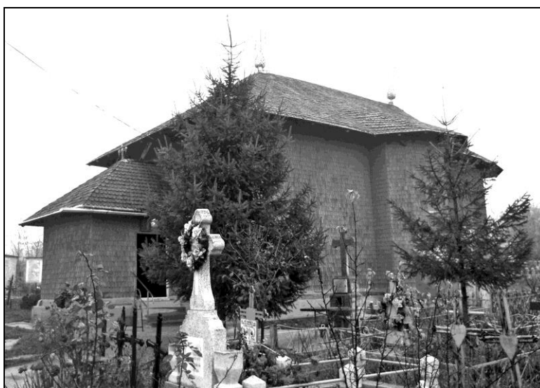
Fig. 2. Biserica Sf. Voievozi din satul Cotârgaci

vândută lui Alecu Miclescu, proprietarul moșiei Cotârgaci 39 . Moșierul a cumpărat ctitoria familiei Stihi și a adus-o pe pământurile sale, înzestrându-o cu 15 prăjini de teren, pământ ales special pentru ridicarea unei biserici și amplasarea unui cimitir în apropierea ei. Alecu Miclescu a primit lăcașul împreună cu veșmintele preoțești donate de principalii ctitori, cumpărând ulterior cărți pentru săvârșirea ritualului bisericesc și un clopot mare 40 . Pentru buna îngrijire a acestei ctitorii, fiecare familie din sat trebuia să desemneze câte un membru care să facă „câte jumătate falce de prășilă, jumătate de seceră, o falce de coasă” și să „meargă cu carul ori de câte ori era chemat” 41 . Oricât de mică ar fi fost o comunitate, oamenii aveau nevoie de o biserică unde să se săvârșească regulat serviciul religios și, mai mult decât atât, de un cimitir în proximitatea lăcașului. Pentru aceasta, ei erau dispuși să îndeplinească serviciile cerute de oamenii legii.