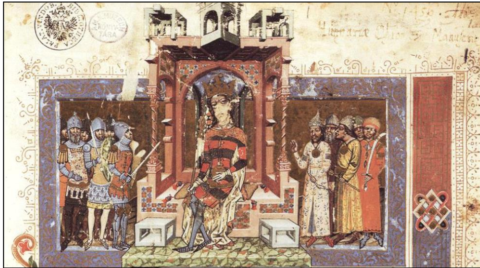
Fig. 1. Ludovic I și supușii săi cruciați și orientali pe pagina de titlu a Cronicii Pictate de la Viena (Országos Széchényi Könyvtár [Biblioteca Națională Széchényi], Budapeșt, CLMae 404)

Ungariei, a cărui istorie trebuia redată prin acea cronică 167 . Mesajul nu era unul conflictual, deși victoriile sale și retorica anti- schismatică și anti- păgână folosită pe larg de rege ar fi îngăduit-o pe deplin 168 , iar în plus, mai ales în vremea tatălui său, coroana ungară își atrăsese deja violente reproșuri din partea „puritană” a Bisericii Romei pentru felul în care se „amestecau” dreptii cu nedreptii în administrarea statului 169 . Este greu de crezut că raporturile erau mai „pure” și mai „nete” în sudul și estul provinciei regale a Transilvaniei și în special pe cel mai scurt drum care trebuia să lege regatul de Gurile Dunării, cu bizantini, bulgari, genovezi, tătari ori valahi 170 .